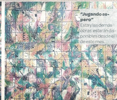
"Jugando espero" Esta y las demás obras estarán disponibles desde el 11 de este mes.