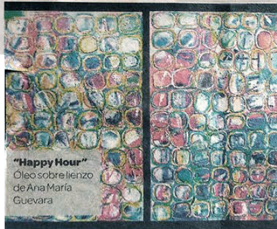
"Happy Hour" Óleo sobre lienzo de Ana María Guevara